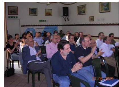
Una fase dell'ultima assemblea elettiva