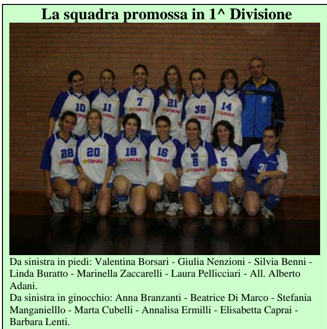
La squadra promossa in 1 a Divisione